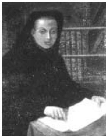
RETRATO DEL PADRE FEUILLÉE.

yectado volver al archipiélago canario para llevar a cabo distintas mediciones de importancia para la navegación en el Atlántico; sin embargo, la guerra entre España y Francia, así como una epidemia de peste que asoló Marsella en 1720 truncaron su propósito. Por fin, en 1724, la Academia de Ciencias francesa pudo encomendarle la realización de diversas observaciones científicas en Canarias, que se deberían completar con otras que efectuaría en el Observatorio de París. De este modo, emprendió, nada menos que a los sesenta y cuatro años de edad, su última misión oficial, culminando así una dilatada e importante trayectoria científica y viajera con la que sería la primera exploración de esta naturaleza que tuvo por destino específico el archipiélago canario.